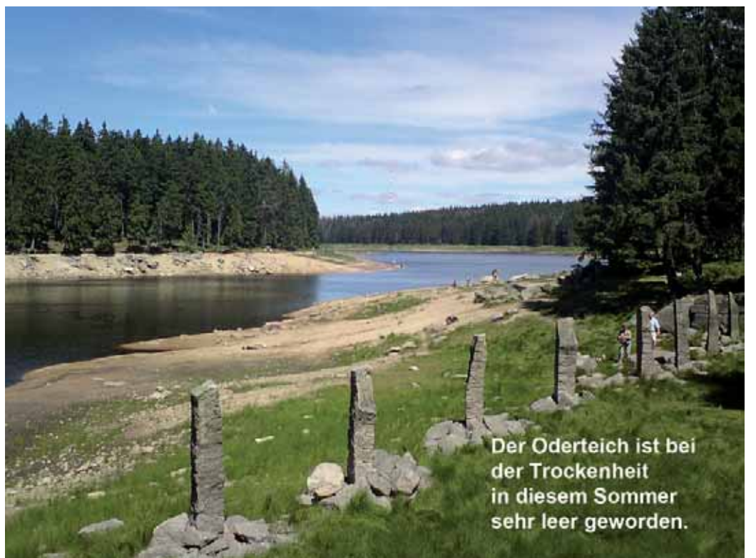
Der Oderteich ist bei der Trockenheit in diesem Sommer sehr leer geworden.